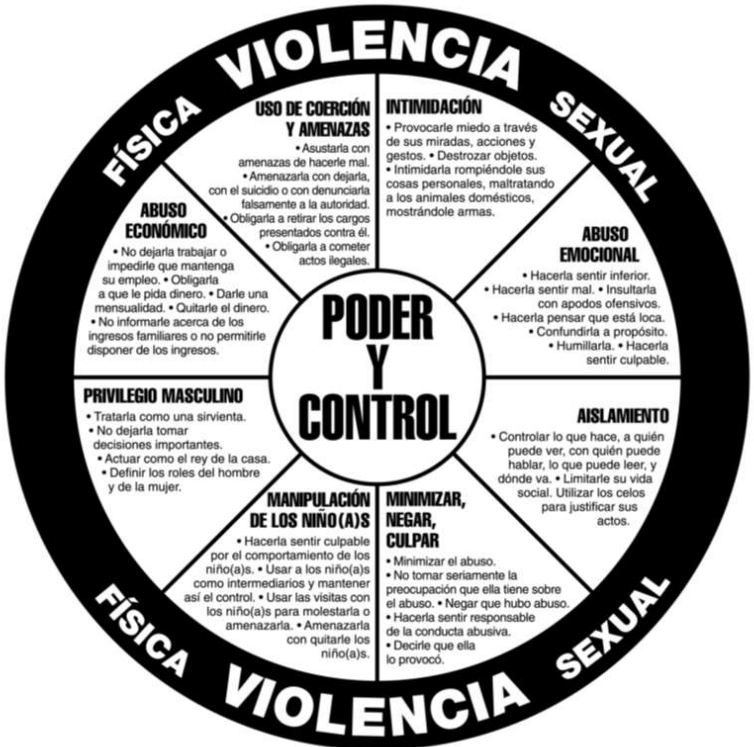
Diagrama 1 - Rueda de Duluth Violencia Domestica – Poder y Control Domestic Abuse Intervention Project www.theduluthmodel.org